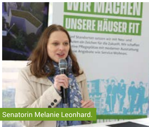
Senatorin Melanie Leonhard.

Der offizielle Akt der Grundsteinlegung.